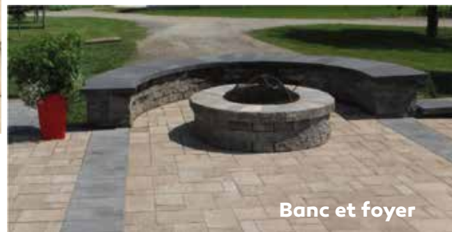
Banc et foyer

SPÉCIALISTE DE L'AMÉNAGEMENT PAYSAGER DEPUIS 1985