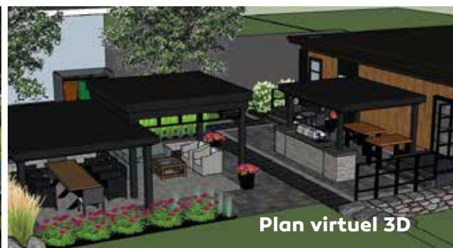
Plan virtuel 3D